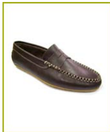
7250 CS04 Castanho

Está autorizada a utilizar o rótulo Biocalce Básico, em calçado de senhora de acordo com as especificações expressas no boletim de ensaios: CQ-1802/2008 de 2008/11/2008, CQ-1801/2008 de 2008/11/28 e CQ-1754/2008 de 2008/11/28 para os seguintes artigos: