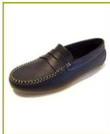
7250 CS04 Preto