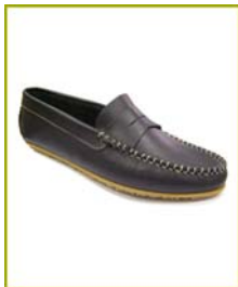
7250 CS04 Azul Marinho